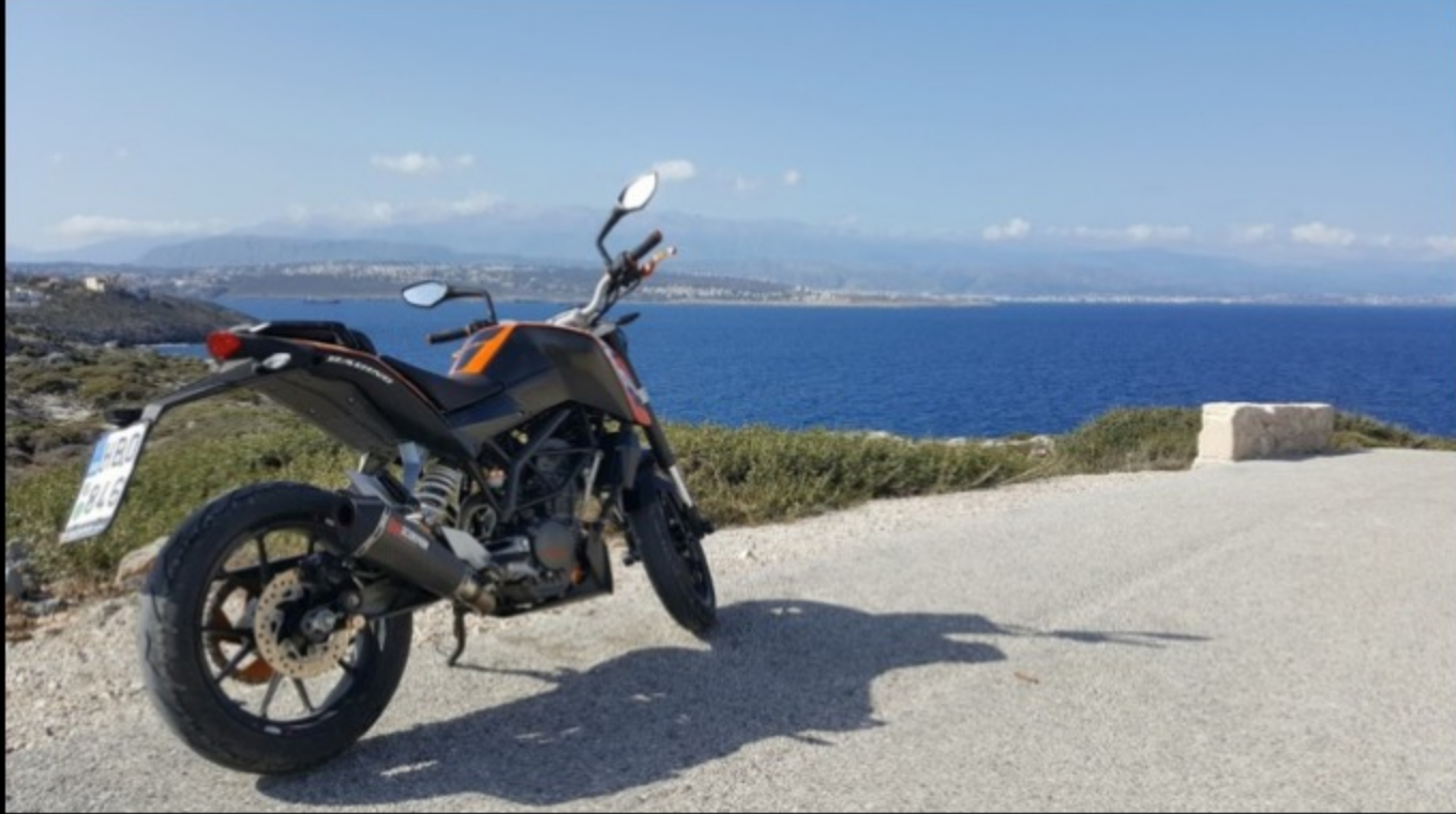
Stavros, Crète. Ma moto : KTM Duke 125. Parfaite pour la Crète